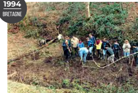
Opération de reforestation (chênes et châtaigniers) à La Corbinière.