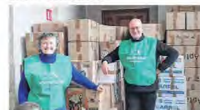
L'association Nouvelle Acropole a organisé une collecte en faveur des réfugiés ukrainiens Nouvelle Acropole

BOISSY-LÈS-PERCHE L'association Nouvelle Acropole siègeant à la Cour Pétril à Boissy-lès-Perche a récemment organisé une collecte de dons, en lien avec la mairie de L'Aigle. En effet, la ville de L'Aigle, jumelée avec Spisska-Nova-Ves, située en Slovaquie, se sont associées dans une mission humanitaire, pour venir en aide aux populations ukrainiennes. Une collecte de dons s'est tenue, du 21 mars au 1 er avril 2022, dans les locaux de l'hôtel de ville de L'Aigle et a, ensuite, été acheminée le lundi 4 avril à Spisska-Nova-Ves. Les membres de l'association Nouvelle Acropole de Boissy-lès-Perche ont montré une grande générosité et leurs dons sont venus grossir ceux déjà bien étoffés de la mairie de L'Aigle. Pour eux, cette action de soutien était essentielle pour témoigner de leur solidarité avec la population ukrainienne victime de guerre et de leur souhait de paix et de concorde entre tous les êtres humains.