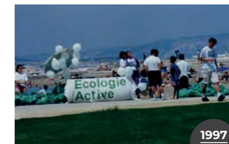
Nettoyage de plages.

Depuis les années 90 Nouvelle Acropole mène des actions autour de l'eau pour lutter contre la pollution des lacs, rivières et mers et œuvre pour sensibiliser au fait que l'eau, source de vie, est un élément naturel à protéger.