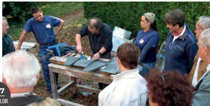
2017 EURE ET LOIR

La Cour Pétral : l'ancienne abbaye restaurée par Nouvelle Acropole ouvre ses portes chaque année pour les Journées du Patrimoine pour accueillir des centaines de visiteurs.