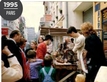
Démonstration de tour à bois en présence des élus du quartier.