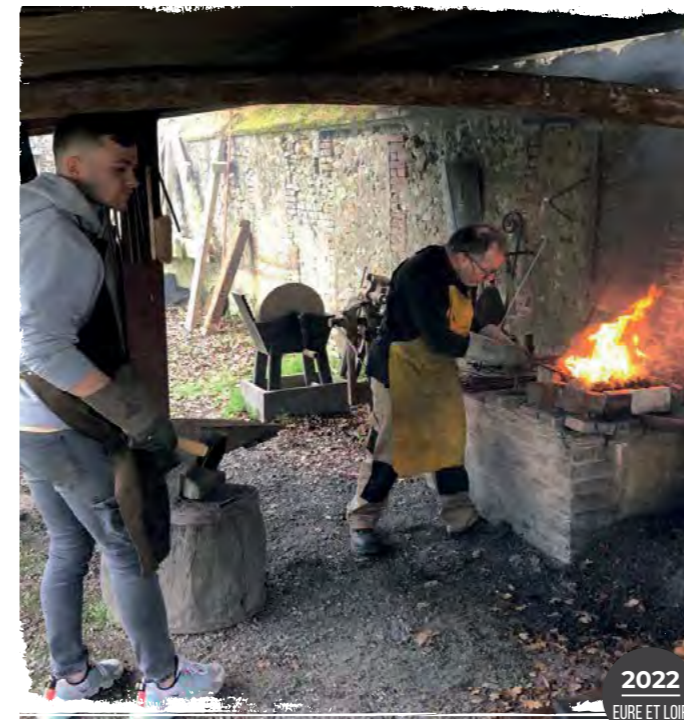
2022 EURE ET LOIR