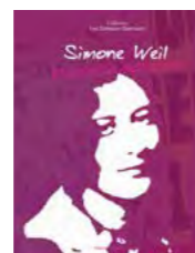
Publication en 2009 d'un dossier spécial Simone Weil, philosophe de l'absolu, réalisation d'un buste de la philosophe, exposition pédagogique en collaboration avec sa nièce, Sylvie Weil, nombreuses conférences et séminaires pour présenter sa pensée et son œuvre, réalisation d'un site simoneweil.fr .

C'est avec une grande clarté que Simone Weil a souligné pour les hommes et les sociétés modernes l'importance des besoins de l'âme sur les besoins matériels.