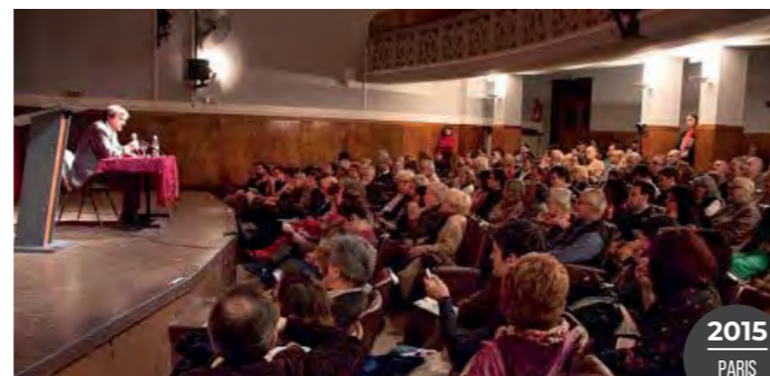
Le philosophe Bertrand Vergely dans le cadre de la journée mondiale de la philosophie promue par l'UNESCO, le 3 e jeudi de novembre.