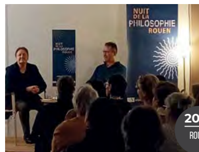
Le philosophe Denis Marquet pour la Nuit de la Philosophie sur le thème Guérir d'un monde malade.

Dans le cadre du festival Nuit de la philosophie, organisation d'un colloque sur le thème La philosophie un art de vivre rassemblant une dizaine de philosophes de plusieurs pays.